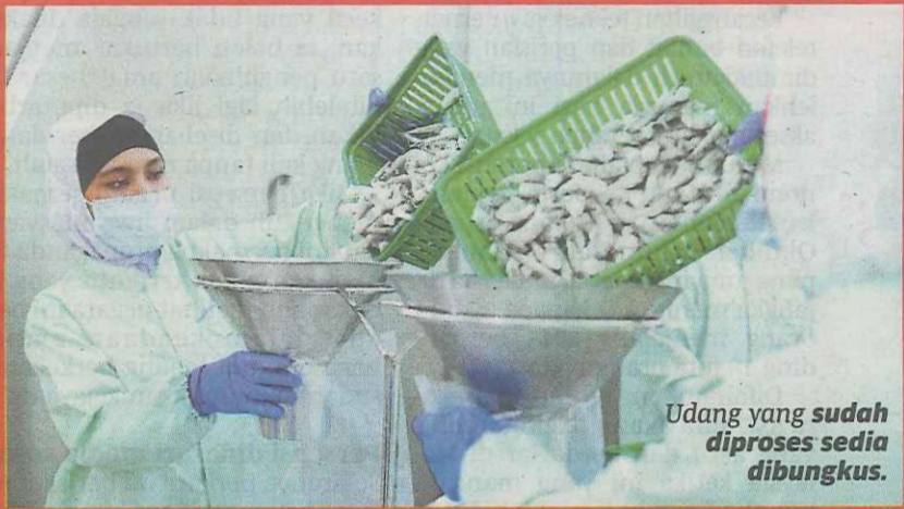
Udang yang sudah diproses sedia dibungkus.