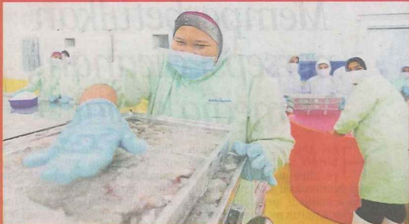
Pekerja mengasingkan udang di Pusat Pemrosesan Blue Archipelago.