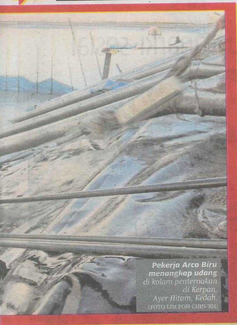
Pekerja Arca Biru menangkap udang di kolam penternakan di Kerpan, Ayer Hitam, Kedah.

Bagi bekas pemilik sawah, projek itu menyimpan seribu satu kenangan pahit manis, selain memberi manfaat peluang pekerjaan kepada penduduk kampung sekitarnya.