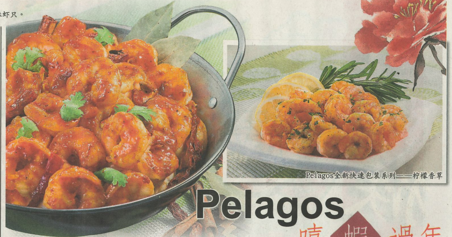
Pelagos全新快速包装系列——柠檬香草